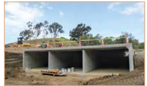
Los cruces para la vida silvestre pasarán por debajo de la nueva SR 76.