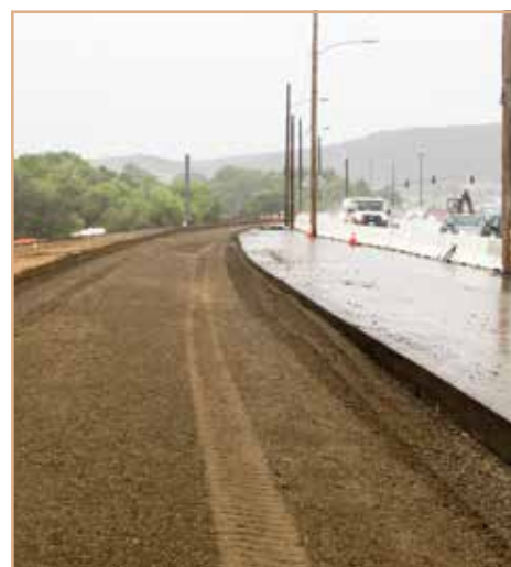
Los carriles nuevos serán pavimentados antes del cambio del flujo de tráfico.

Información Teléfono: (619) 688-6670 Visite: KeepSanDiegoMoving.com