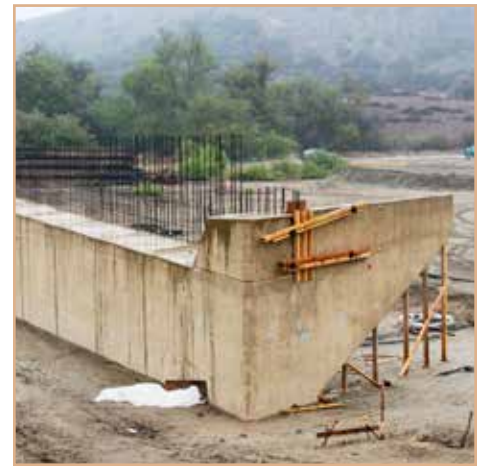
Construcción de la base del puente en la parte este.