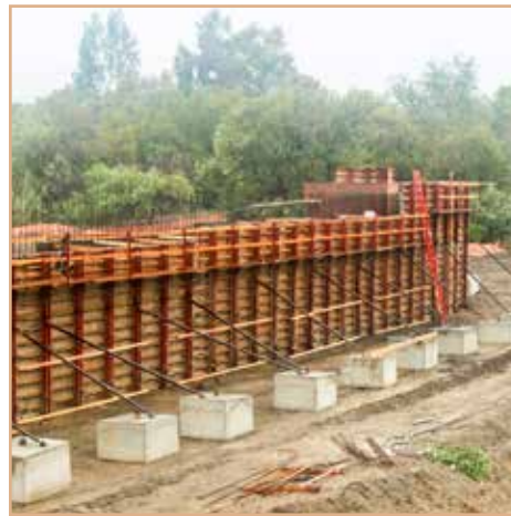
Construcción en la parte oeste de la base del puente.

El reemplazo del puente Live Oak Creek Bridge es un componente del proyecto en que los equipos de construcción están trabajando activamente. El puente original se construyó en 1948, y está siendo reemplazado con un puente más amplio, largo y alto para satisfacer las necesidades de la expansión de SR 76. El puente será de 105 pies de longitud por 125 pies de ancho. Este puente también funcionará como una conexión del flujo del agua y de los movimientos de la vida silvestre entre las partes norte y sur de SR 76. El acceso al puente y al río será parte del San Luis Rey Park, el cual está siendo planeado por el Condado de San Diego.