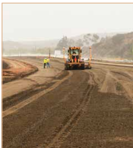
Equipos de construcción preparan la pavimentación de los carriles nuevos.