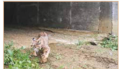
Ejemplo de vida silvestre usando los túneles.