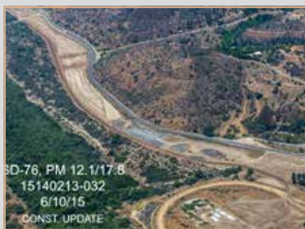
Vista desde el cielo del Segmento Este de SR 76.

El proyecto del corredor SR 76 forma parte del programa TransNet Early Action Program, el cual recibe fondos del impuesto a las ventas de medio centavo para acelerar proyectos de transporte de alta prioridad. Los fondos de TransNet se suman a fondos federales, tarifas de transporte del condado de San Diego y a las contribuciones de las tribus nativo americanas.